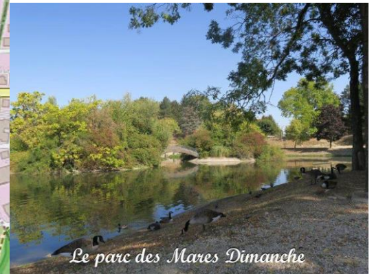
Le parc des Mares Dimanche

Un tour de la ville passant par les parcs et squares ainsi que par le quartier du Pavé Neuf à l'architecture particulière due à l'espagnol Manuel Nunez Yanowsky.